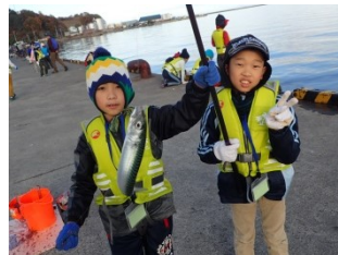
安全のため二人で一竿