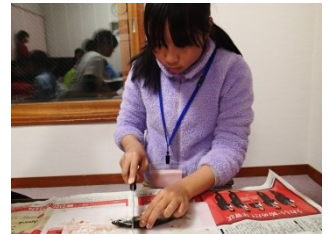
魚をさばいて調理する