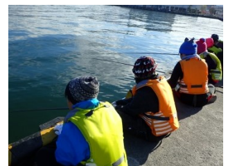
海に背中を向けない、のぞき込まない