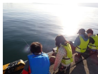
安全のため2人で1竿