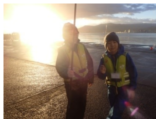
日の出とともに活動開始