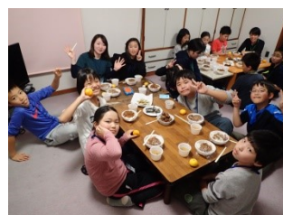
魚をさばいて、楽しい夕食